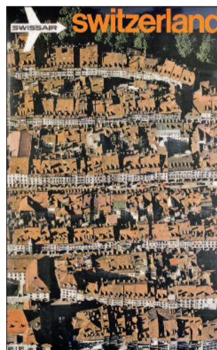
Deux approches de la vue aérienne, avec les publicités Année 1970 de Swissair par Georg Gerster (à gauche) et les visions urbaines de Mexico par Pablo Lopez Luz.