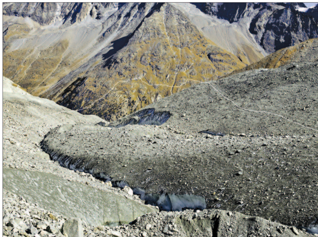
En balade au-dessus de 2000 m, là où les paysages sont exempts de végétation, Nicolas Crispini photographie la rocaille sur laquelle il superpose le dénivelé enregistré par son GPS.

Le catalogue High altitude est disponible aux Editions 5 Continents