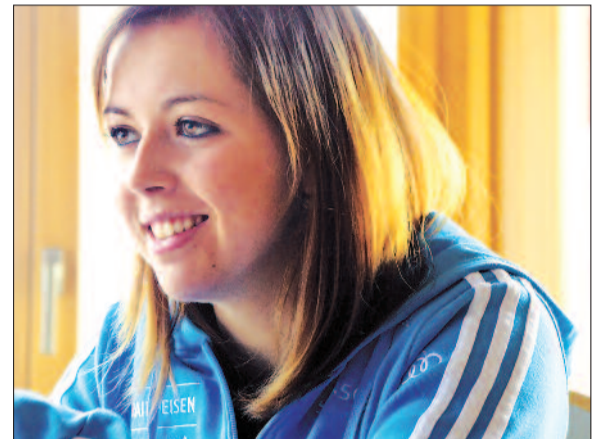
ARCH - J. GENOUD

ROSSIÈRE. Pour sa troisième édition, le festival de photographie Alt. + 1000 expose les travaux de douze photographes contemporains. Avec pour but de prendre de l'altitude sur notre monde. page 5