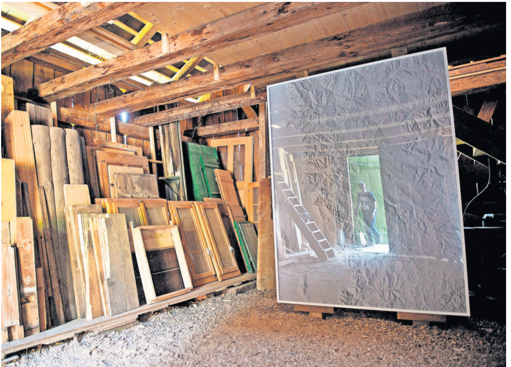
Pour sa troisième édition, le festival Alt +1000 se consacre au thème de l'altitude grâce aux images d'une trentaine de photographes. Ici, le Britannique Dan Holdsworth expose ses images dans une grange. D'autres clichés sont visibles en plein champ. Lire en pages 28-29