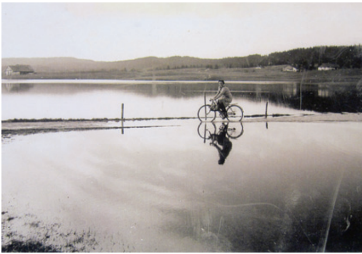
Premier prix: un souvenir de l'inondation de novembre 1950. ARIELLE GRABER