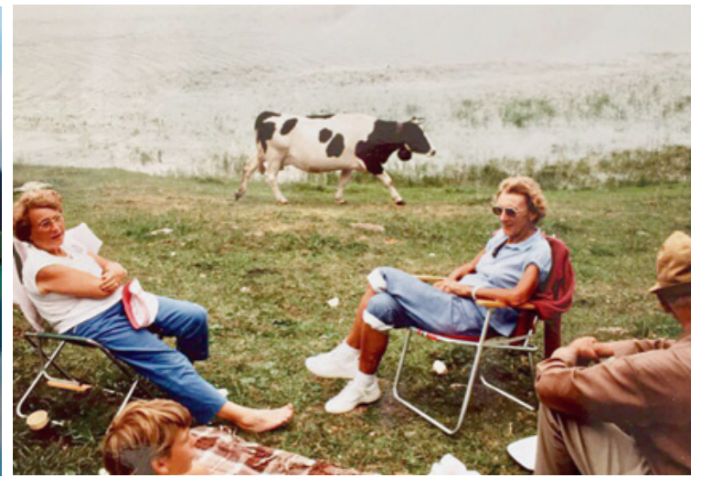
Troisième prix: la vache et les pique-niqueurs, reflet d'un dimanche à la campagne. DANIELE NEUENSCHWANDER